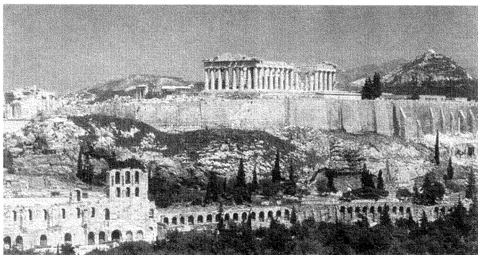
丘の上に建つパルテノン神殿、左手前に見えるのはローマ時代の劇場

A 現在、アテネの中心部の丘にその偉容を誇る① パルテノン神殿 は、古代ギリシアを象徴する歴史的建造物である。この神殿は、② オスマン帝国 の支配下でモスクとして利用されたこともあったが、18世紀には はいきよ 廃墟となっていた。1799年にイギリスの大使としてイスタンブルに赴任したエルギン きよう 卿は、③ ギリシア を訪れ、パルテノン神殿の遺跡から彫刻類を収集し、本国に送った。今日、大英博物館で「エルギン・マーブル」として展示されているものがそれである。1987年、パルテノン神殿は、世界文化遺産として登録された。