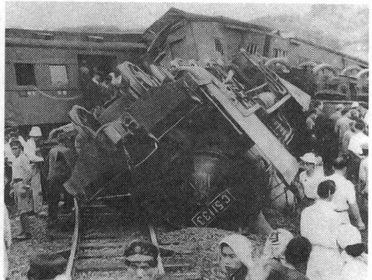
Y 福島県(東北本線松川駅付近)